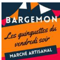
©Marché artisanal nocturne